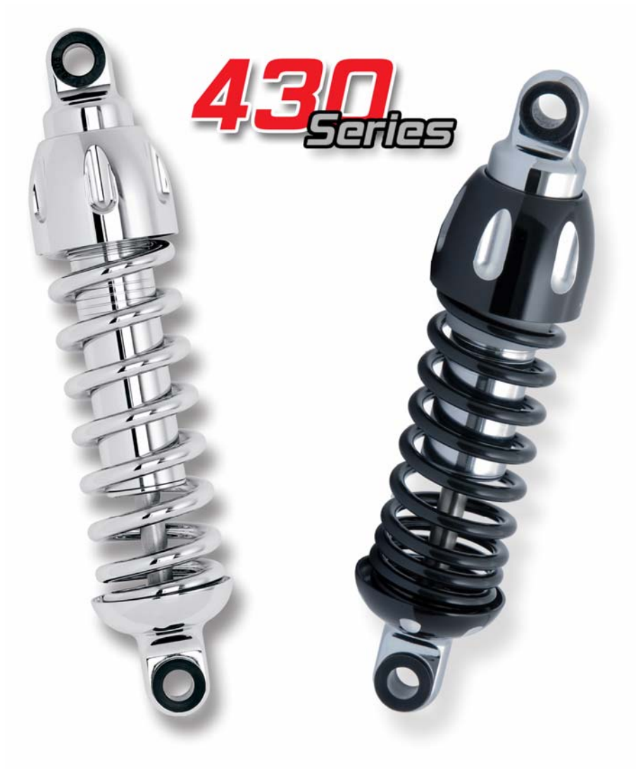
Stoßdämpfer Progressive Suspension Typ 430